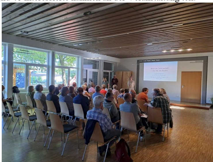
Im Gemeindehaus der Corvinus-Kirchengemeinde Northeim informierten sich Baubeauftragte und Küster aus den Kirchenkreisen Harzer Land und Leine-Solling über Schadensprävention, Grundlagen des Bauwesens und den Austausch bewährter Erfahrungen.

Die Tagungsunterlagen stehen für weitere Interessierte bereit. Diese können per E-Mail beim Kirchenamt angefordert werden unter: bau.kirchenamtnortheim@evlka.de