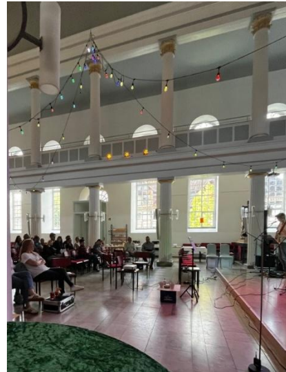
Die Wohnzimmerkirchen-Band gestaltete den Abend in der Liebfrauenkirche Moringen mit Songs von Clueso, Herbert Grönemeyer, Jeremias und Udo Lindenberg.