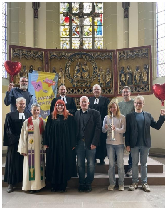
Das Team von „einfachheiraten“ in der Region Northeim: Küster, Kirchenmusiker und Pastoren freuen sich über viele Paare, die sich in der St. Sixti-Kirche kirchlich trauen oder segnen lassen wollen.

All das ist möglich am Freitag, 26. Juni, von 14 bis 19 Uhr. An diesem Tag findet an mehr als 100 Orten unserer Landeskirche die Aktion „einfach heiraten“ statt. Viele Paare, die im Laufe der letzten zehn Jahre standesamtlich geheiratet haben, wurden auch per Postkarte eingeladen.