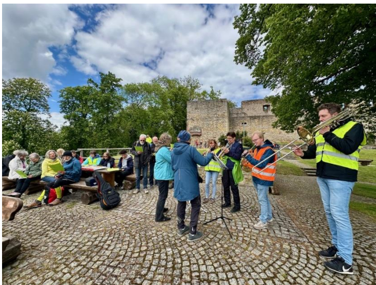
Musikalische Reise durch den Kirchenkreis.

Kirchenkreis. „Fahr aus mein Herz und suche Freud“ war das Motto der musikalischen Radtour, die am Samstag im Rahmen des Mitsing-Festivals der Landeskirche durch die reizvolle, sommerlich-grüne Landschaft des Kirchenkreises Leine-Solling führte. Gestartet wurde mit 30 Teilnehmenden an der Sixti-Kirche Northeim, dann ging es durch das grüne Leinetal an Wiesen und Feldern vorbei in Richtung Kloster Wiebrechtshausen, dem ersten Halt der Tour.