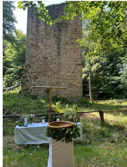
Gottesdienst an der Friwoler Kirchenruine ein.

Dann befindet sich zur linken Hand der Platz, der zur Ruine führt.