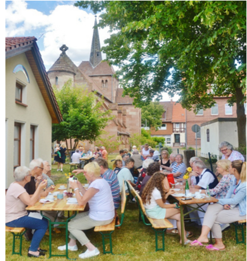
Gemeinsames Essen rund um das Regenbogenhaus