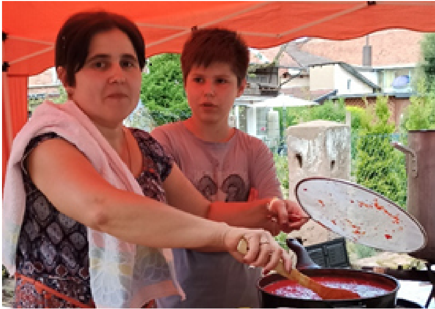
Borscht am Entstehen.