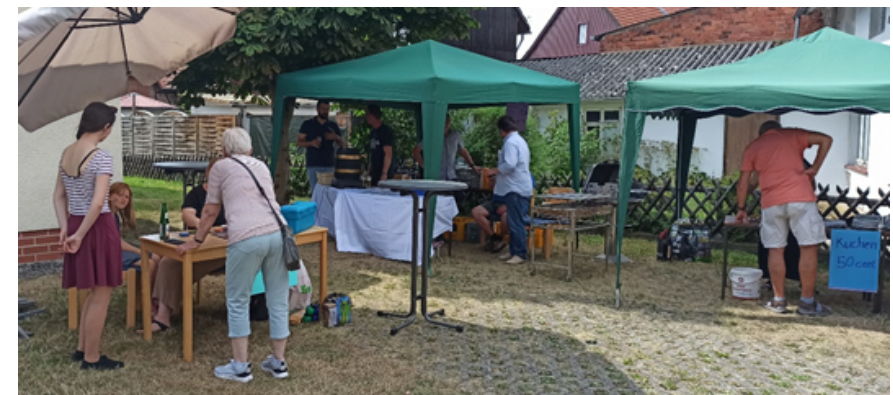
Kinderschminken, gekühlte Getränke, Bratwürstchen im Brötchen, Kaffee und Kuchen