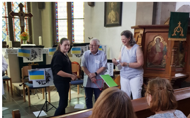
Spendenübergabe in der Kirche