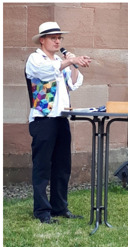
Die Amerikanische Versteigerung