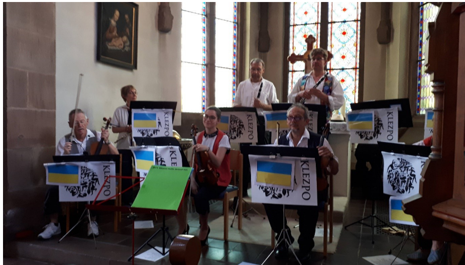
Das KLEPZO - Konzert in der Gustav-Adolf-Kirche