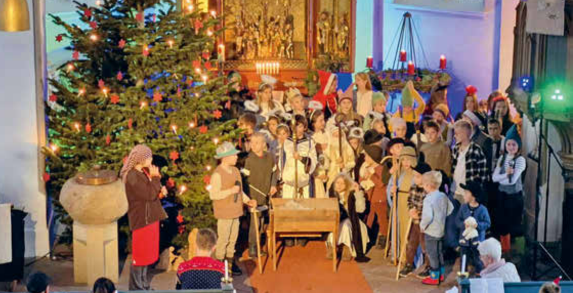
Weihnachten im Märchenwald – Krippenspiel