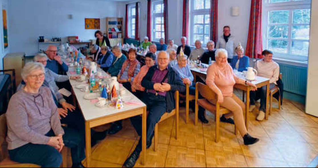
Karneval bei der Gemütlichen Runde