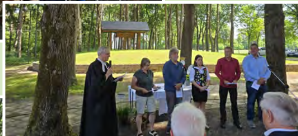
Gottesdienst im Freien, auf dem Schützenplatz Hohe Heide in Elm