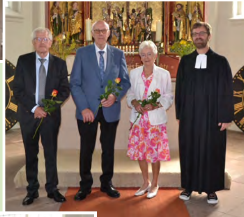
Konfirmationsjubiläen in Bevern. Von oben: Goldene, Diamantene, Eiserne und Ehrenkonfirmation.